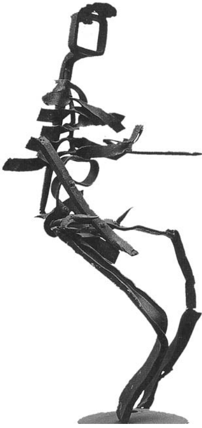
Folfer, Le Paysan

perspectives aléatoires, dans un « marché du travail » marchant au chômage ; « adapté » laissait en suspens la question, peut-être sans solution, de savoir qui s'adapte (s'adapter : se soumettre ?) à quoi et quoi à qui, sachant que les quoi et les qui étaient aussi multiples qu'hétérogènes (origines, milieux, disciplines, caractères, etc.). L'élément positif était constitué par le nombre réduit d'élèves, à peu près une quinzaine – chiffre presque idéal, si l'on ose dire, pour effectuer un enseignement qui ait valeur éducative. C'est le seul qui permette vraiment à l'enseignant de suivre d'assez près et le travail et la personnalité de l'élève, de le reconnaître comme une personne – et l'on sait que la « reconnaissance » est un des éléments clés de toute pédagogie, elle exprime la demande la plus forte de l'élève, comme de tout être humain en général. Dans ces classes dites « en difficulté », le manque de reconnaissance